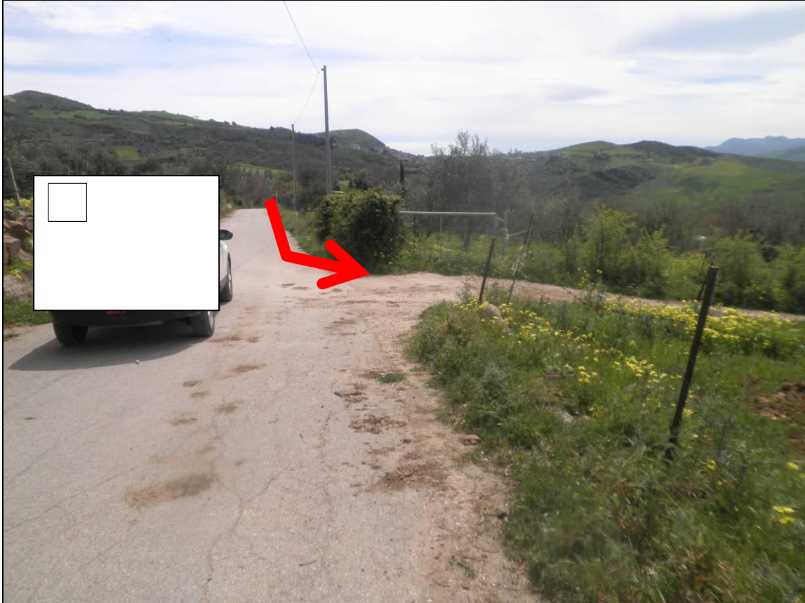
Foto 5/6/7 Ripresa strada comunale con riguardo all'innesto con la stradella accesso all'appezzamento de quo-