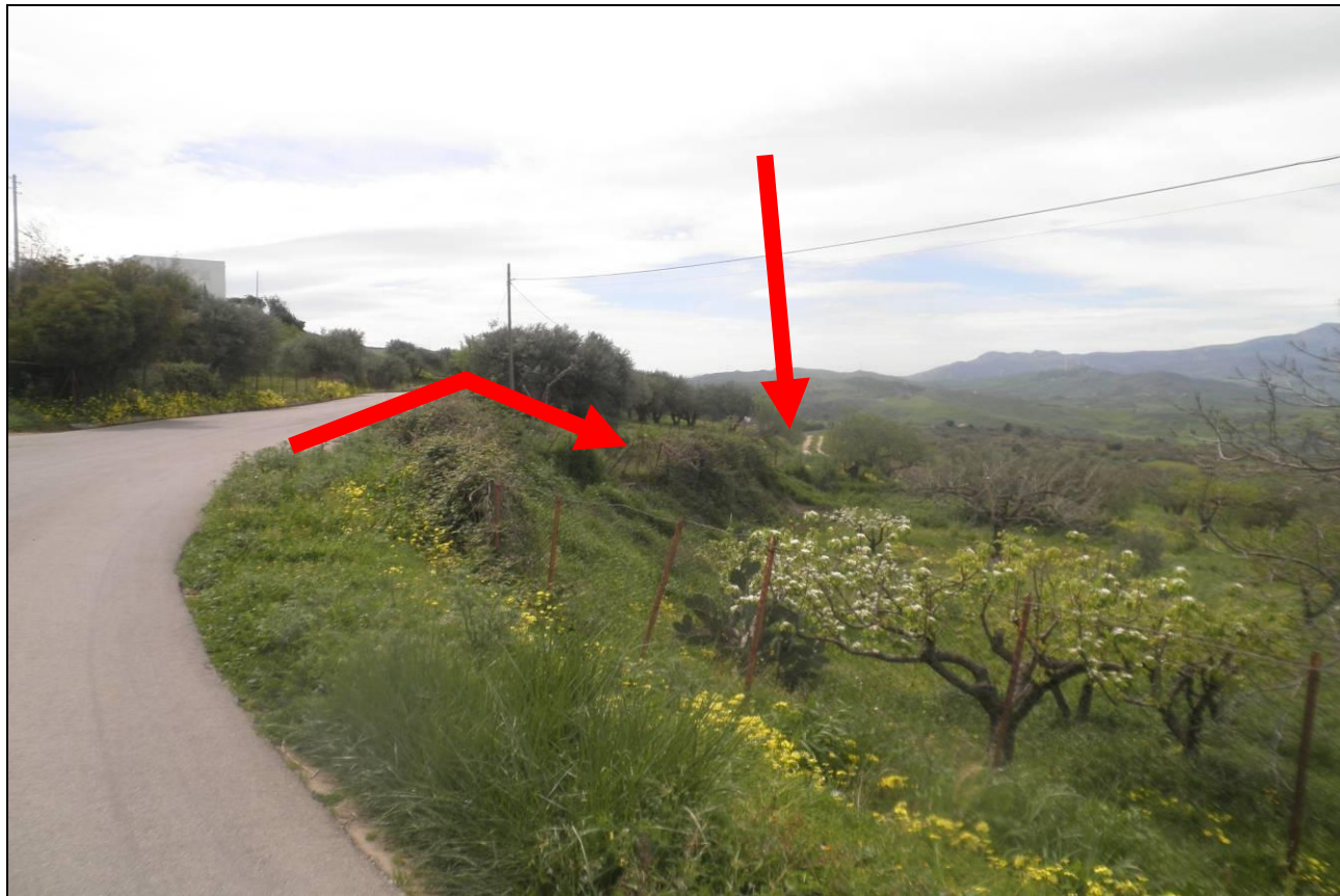
Foto 1/2 - Ripresa SP 16 Km innesto a raso stradella accesso all'appezzamento -