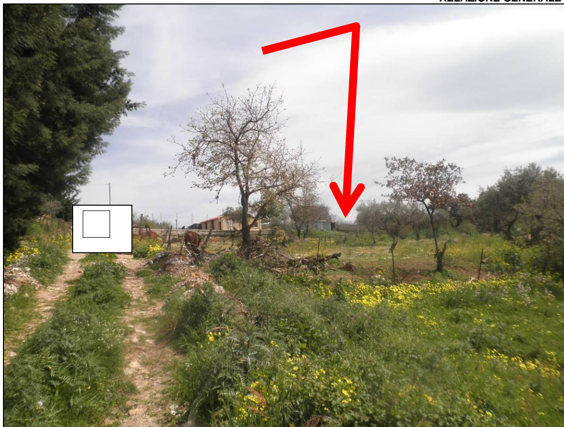
Foto 8/9/10 Ripresa tipologia del terreno oggetto di stima