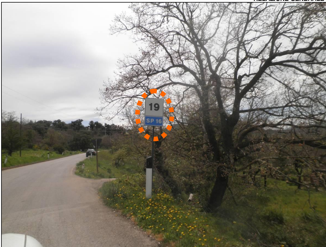
Foto 3 - Ripresa SP 16 Km innesto a raso stradella accesso all'appezzamento -